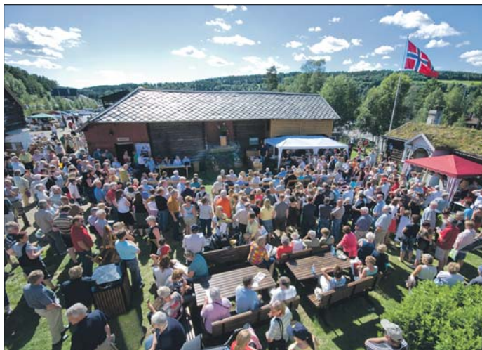
Markedsdag og auksjon på Dølmotunet.