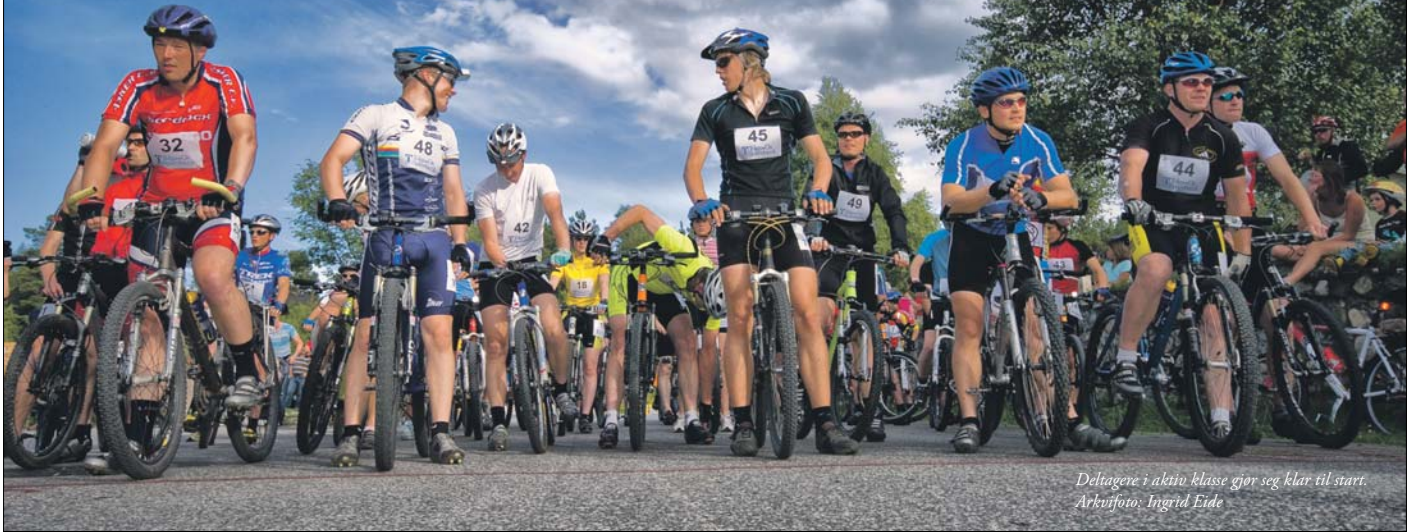
Deltagere i aktiv klasse gjør seg klar til start.

En hver bygd med respekt for seg sjøl har etter hvert et sykkelritt. Sykkelrittet Tallsjøen Rundt har vært et årvissst arrangement i mange år under Olsok i Tolga.