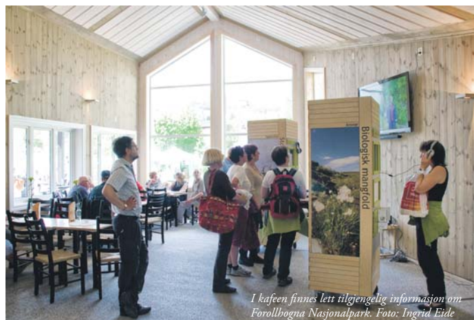
I kaféen finnes lett tilgjengelig informasjon om Forollhogna Nasjonalpark.

matretter basert på lokale råvarer fra Vingelen og Rørosmat. Hun setter stor pris på å være rimelig sjølforsynt med råvarer. Kaféen følger i sommer butikkens åpningstider. Til vinteren vil det bli en for selvbetjening for da må Liv stå i bakeriet!