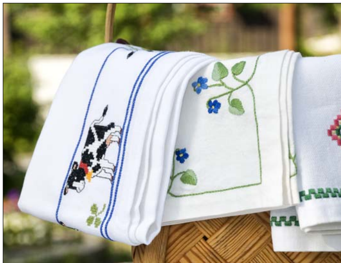
Hodalen bygdekvinne­lag oppfordrer alle hodøler til dyptykk i skuffer og skap på leting etter broderier.

– Det å jobbe med glass er utrolig spennende. Når man åpner ovnen etter at glasset er brent vet man aldri helt hva man får se, selv om man planlegger aldri så mye, sier hun. Tidligere har Aas Rye jobbet både med tekstil, vev og keramikk som uttryksform.