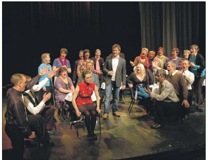
Vingel Singers har som kor vært med i flere prosjekter. Her fikk de prøve sine operakunster under Elgopera-oppsættingen i Tynset Kulturhur i 2006.

I årets olsokuke holder Vingel Singers to konserter, lørdag 30. juli i Tolga kirke og søndag 31. juli i Vingelen kirke. Etter konserten i Vingelen serveres "jubileumskaffe" i Vingelen kirke- og skolemuseum.