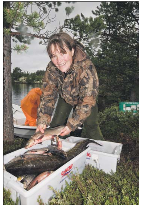
Over: Gjedd på to og en halv kilo må gi tapt for håven. Til høyre: Råstoffet er sikret! Det blir mange kilo fiskekaker av en slik fangst.